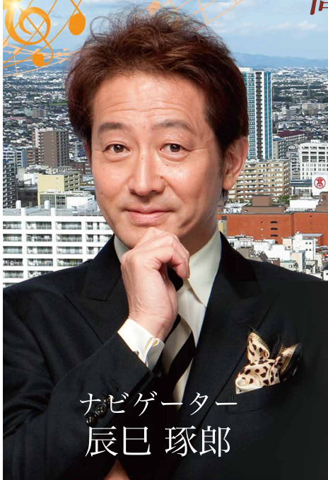
ナビゲーター 辰巳 琢郎