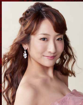
ソプラノ 辰巳 真理恵